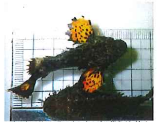
生まれて約4か月のオニオコゼの稚魚(ちぎよ)