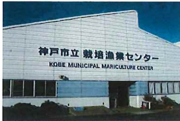
1988年(昭和63年)から生産と放流を始めました