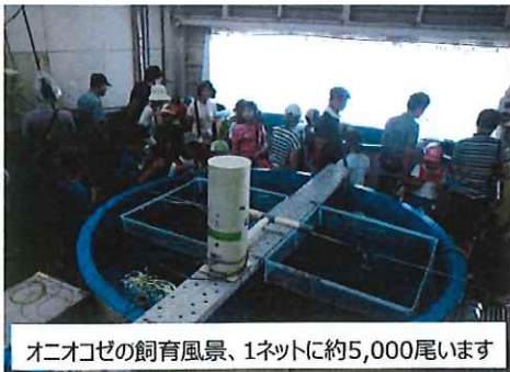
オニオコゼの飼育風景、1ネットに約5,000尾います