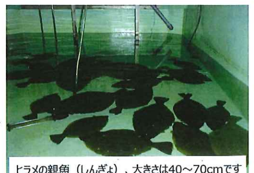
ヒラメの親魚(しんぎよ)、大きさは40~70cmです